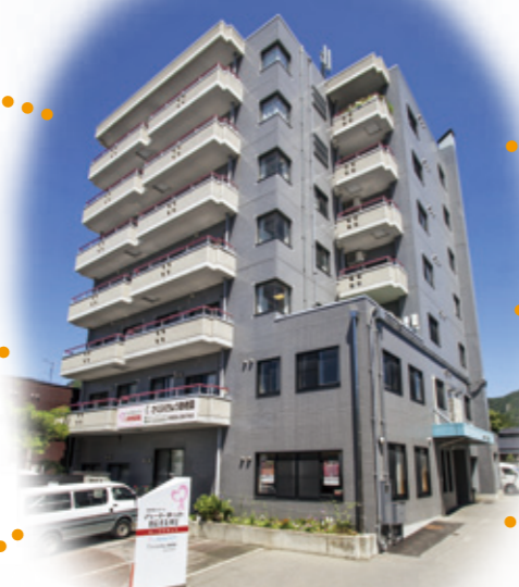
ハートネット桜枝町